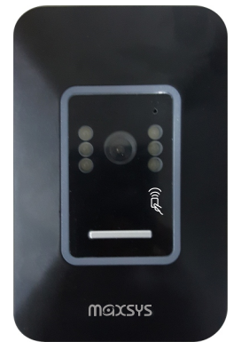
感應式維根信號輸出